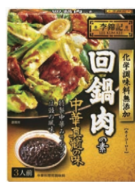
李錦記 回鍋肉の素