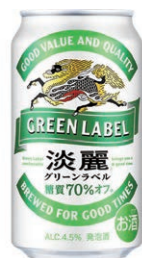
淡麗グリーンラベル