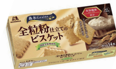
全粒粉仕立てのビスケット