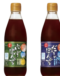
ゆずぼんず だしぼんず