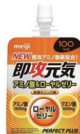
即攻元気 アミノ酸&ローヤルゼリー