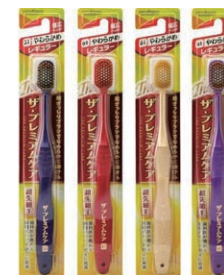
ザ・プレミアムケア 歯ブラシ