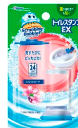
スクラビングバブル