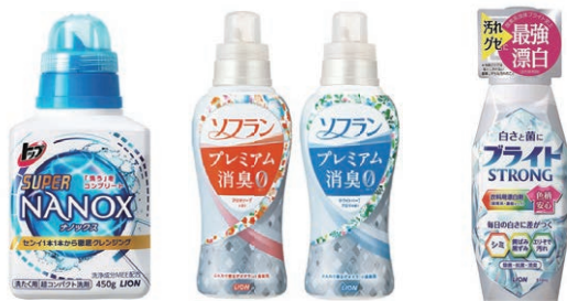
ナノックス ソフラン プレミアム消臭 ブライトSTRONG