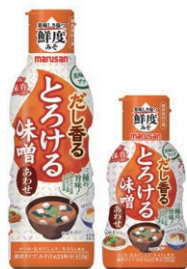
だし香る とろける味噌